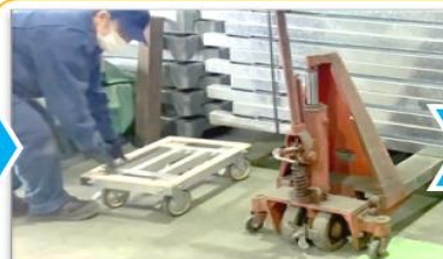
ハンドパレットで上げ、バタ角と差し替え