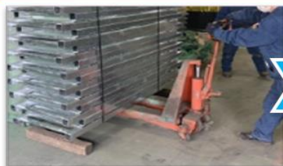
ハンドパレットで上げ、本機に載せ替え